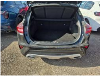
Imagen - 16