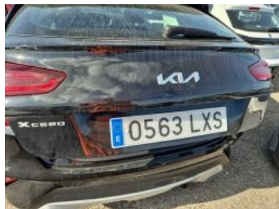
Imagen - 50