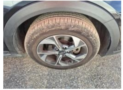
Imagen - 24