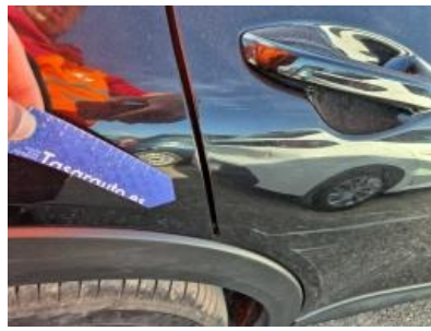
Imagen - 53