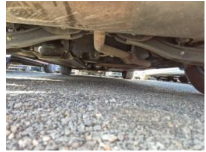
Imagen - 15