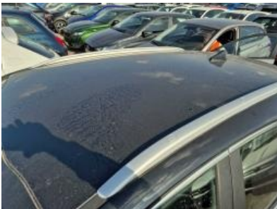
Imagen - 31