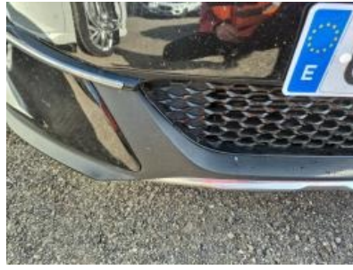
Imagen - 38