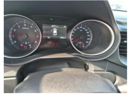
Imagen - 9