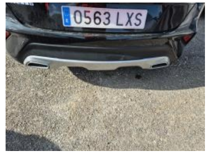
Imagen - 54