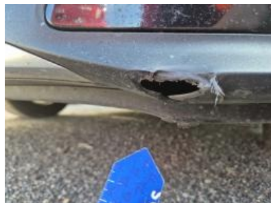
Imagen - 35