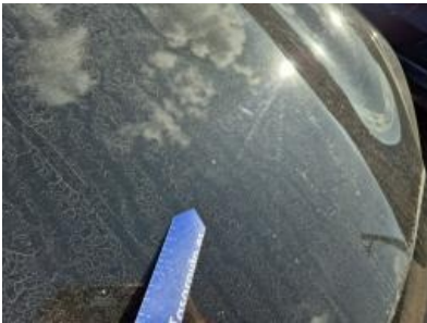
Imagen - 28