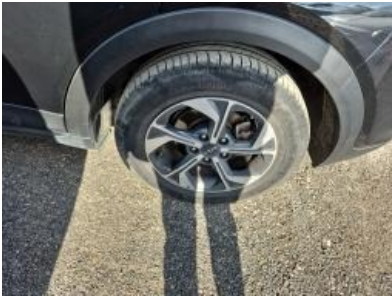
Imagen - 22