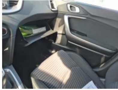
Imagen - 11