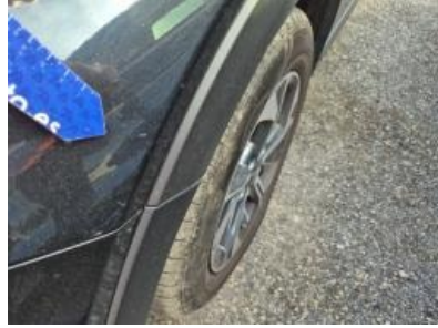
Imagen - 41