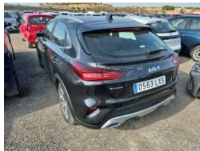
Imagen - 2