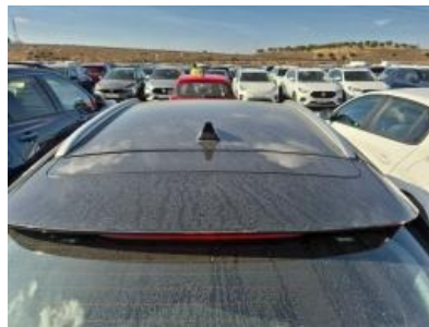
Imagen - 20