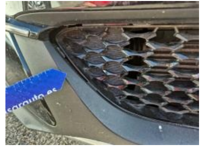
Imagen - 39