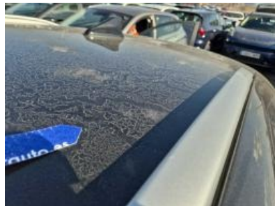
Imagen - 32