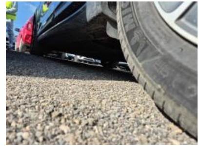
Imagen - 18