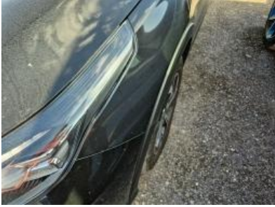
Imagen - 40