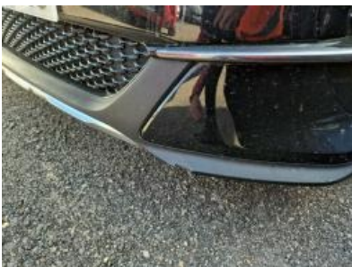
Imagen - 34