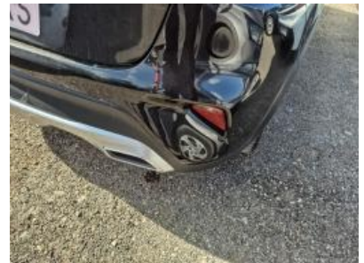
Imagen - 48