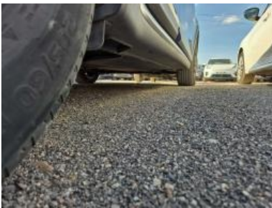
Imagen - 19