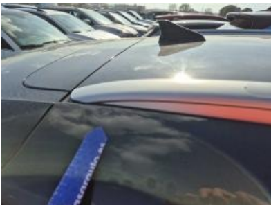
Imagen - 61