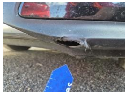
Imagen - 36