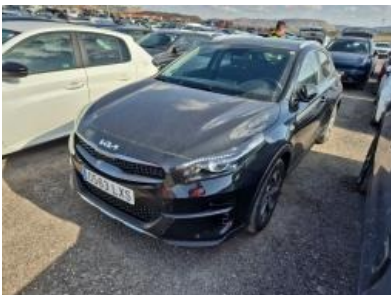
Imagen - 1