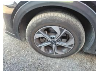
Imagen - 21