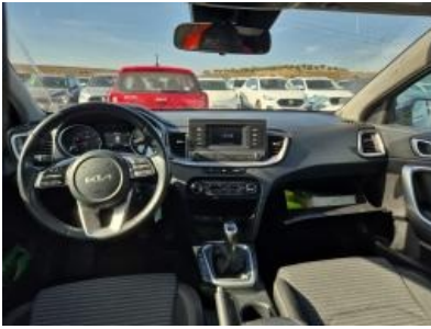
Imagen - 13