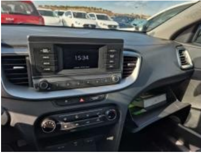
Imagen - 10