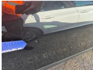
Imagen - 59