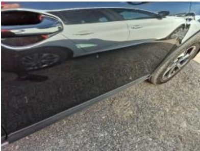
Imagen - 58