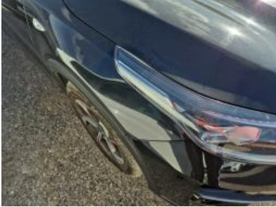
Imagen - 25