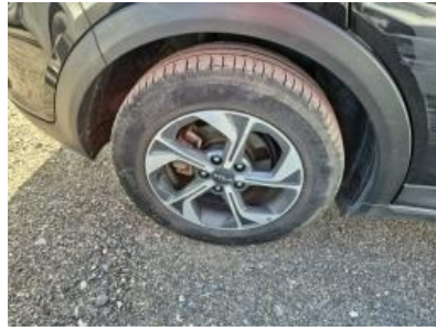
Imagen - 23