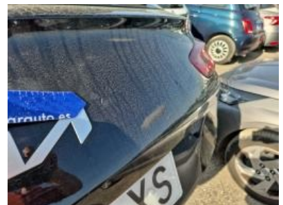
Imagen - 51