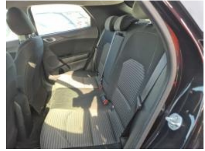
Imagen - 12