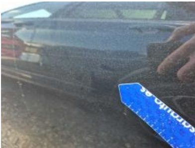
Imagen - 43