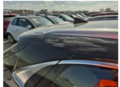
Imagen - 60