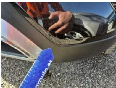
Imagen - 49