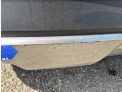
Imagen - 55