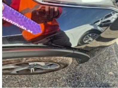
Imagen - 26