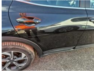
Imagen - 56