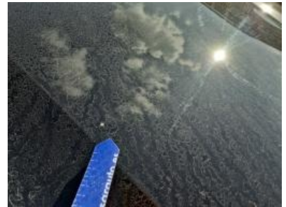
Imagen - 30