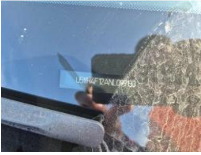
Imagen - 7