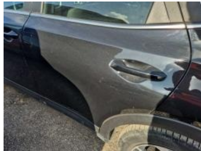
Imagen - 44