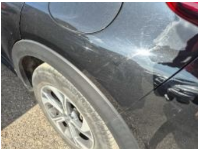
Imagen - 46