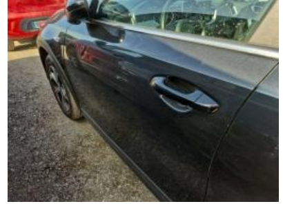
Imagen - 42