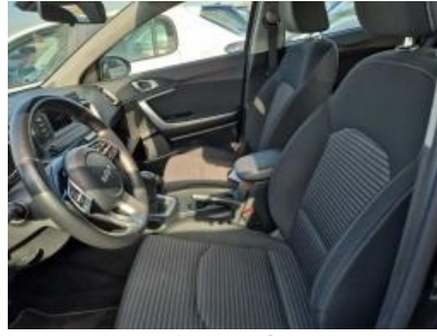
Imagen - 8