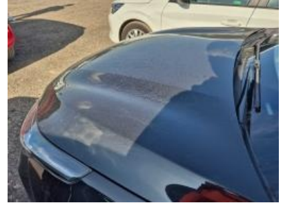
Imagen - 27