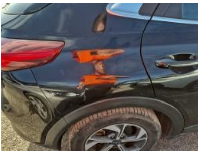
Imagen - 52