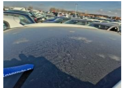
Imagen - 33