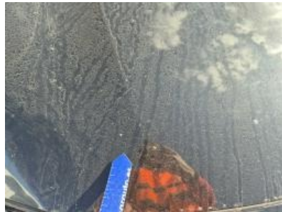
Imagen - 29