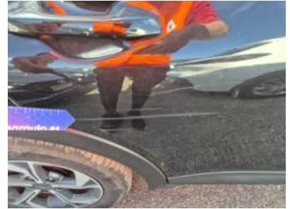
Imagen - 57