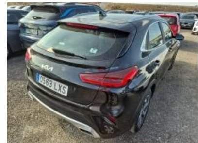
Imagen - 3