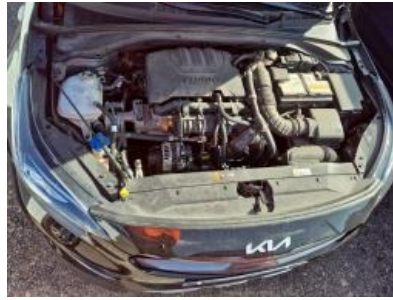
Imagen - 14