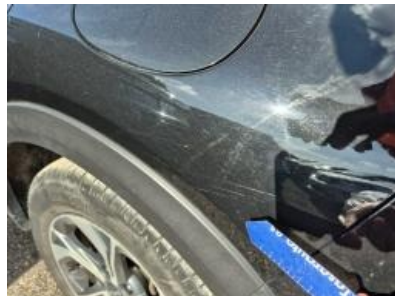
Imagen - 47