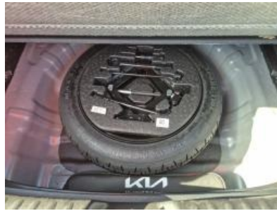
Imagen - 17