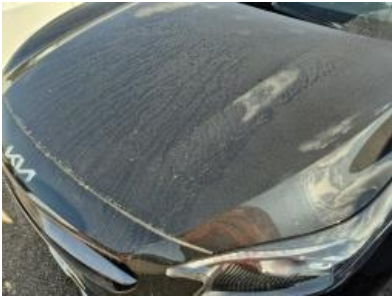
Imagen - 37