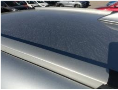
Imagen - 37