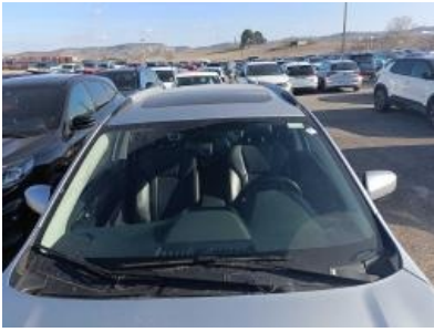
Imagen - 7