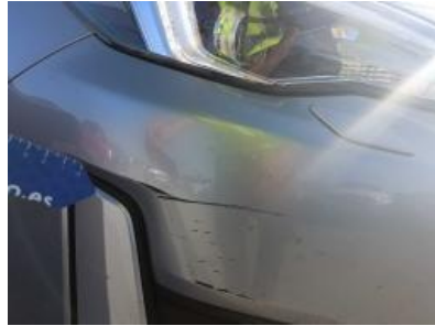
Imagen - 26