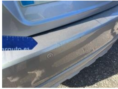
Imagen - 38