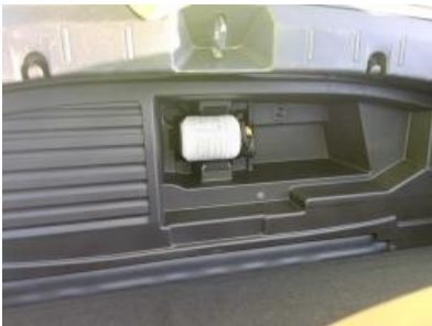
Imagen - 16