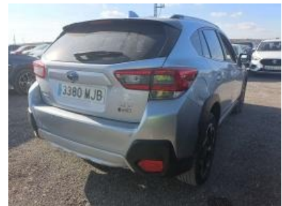
Imagen - 3