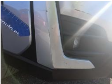
Imagen - 28