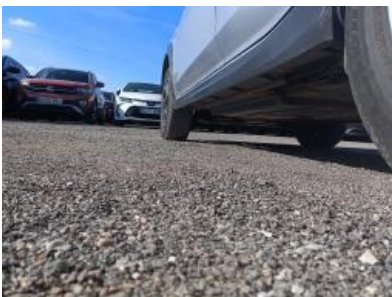
Imagen - 19