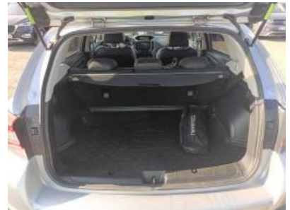
Imagen - 15