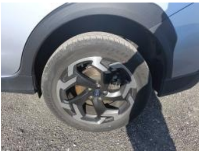
Imagen - 22