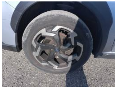
Imagen - 23