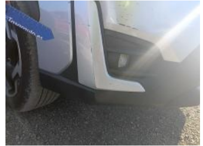
Imagen - 27