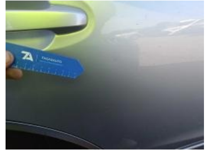
Imagen - 42