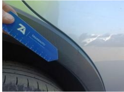
Imagen - 41