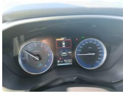
Imagen - 8