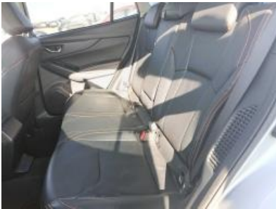
Imagen - 13