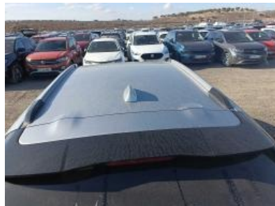
Imagen - 17