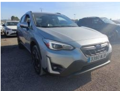
Imagen - 4