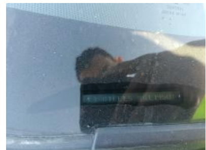
Imagen - 6