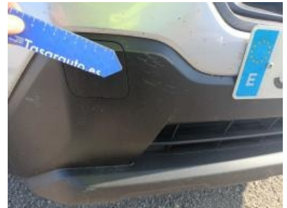
Imagen - 30