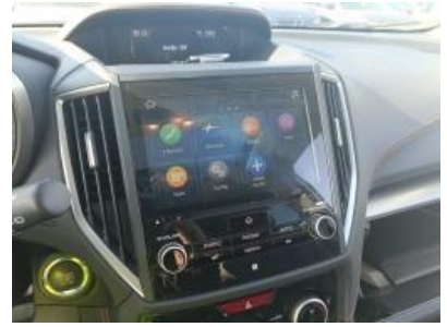
Imagen - 9