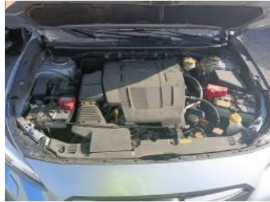
Imagen - 11