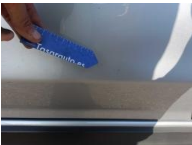
Imagen - 34