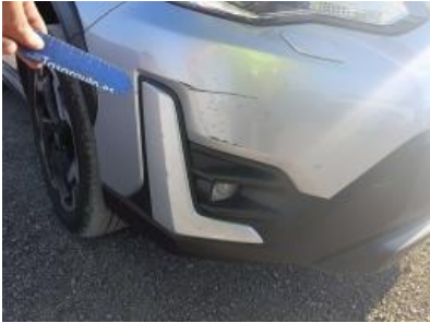
Imagen - 25