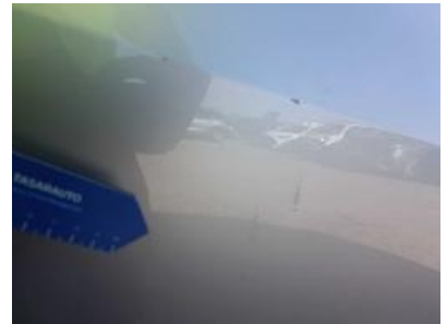
Imagen - 45