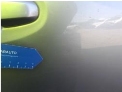
Imagen - 43