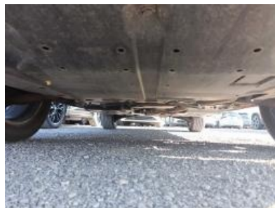
Imagen - 5