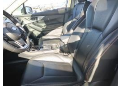
Imagen - 12