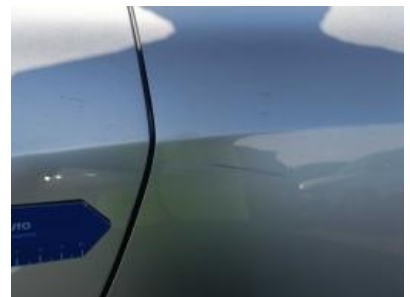
Imagen - 36