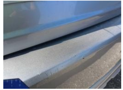
Imagen - 39