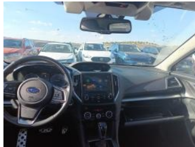
Imagen - 14