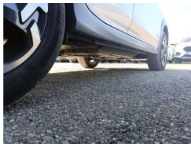
Imagen - 20