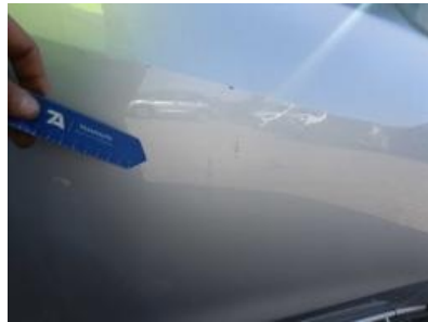
Imagen - 44