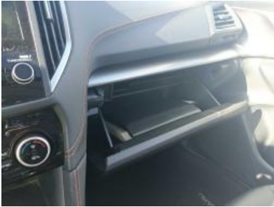
Imagen - 10