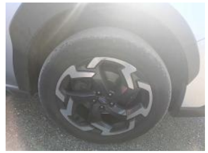
Imagen - 24