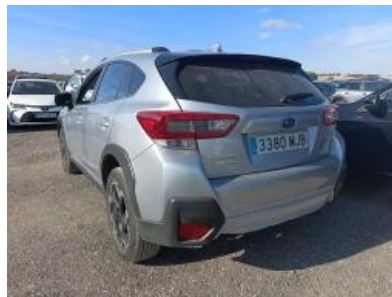
Imagen - 2