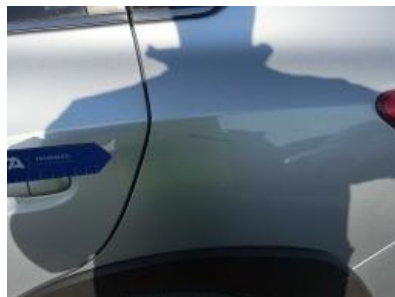
Imagen - 35