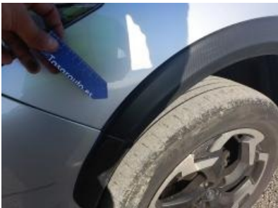
Imagen - 31