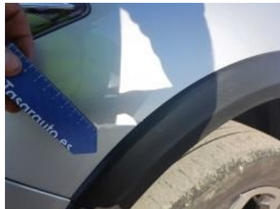
Imagen - 32