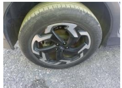
Imagen - 21