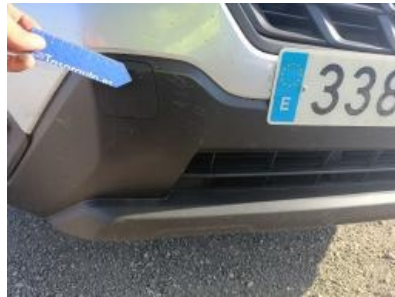
Imagen - 29