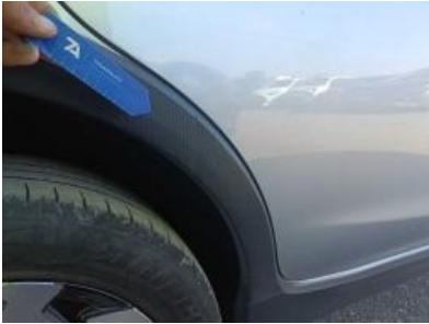
Imagen - 40