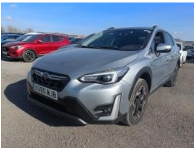
Imagen - 1