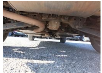
Imagen - 18