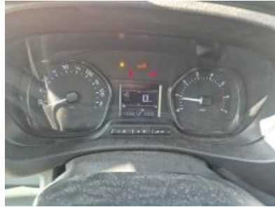
Imagen - 11