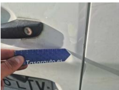
Imagen - 34