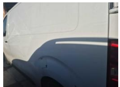
Imagen - 36