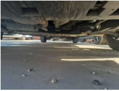
Imagen - 7