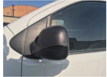
Imagen - 42