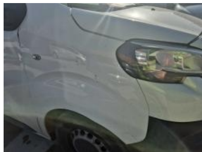
Imagen - 50