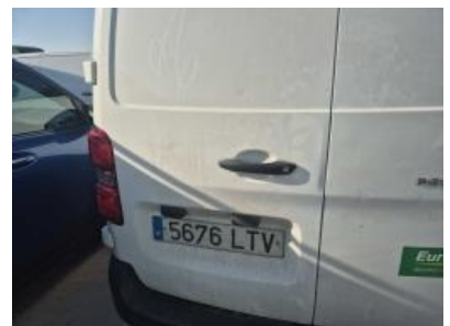
Imagen - 33