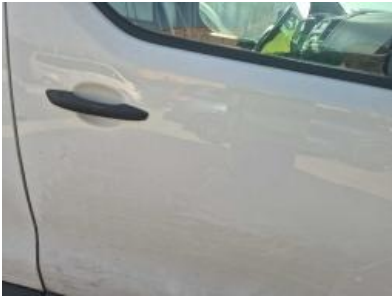
Imagen - 52