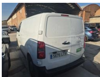
Imagen - 2