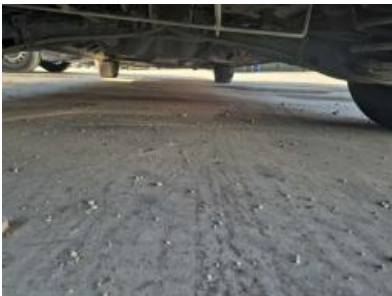
Imagen - 16