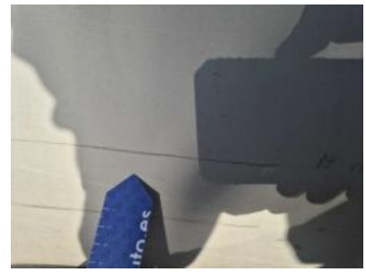
Imagen - 39