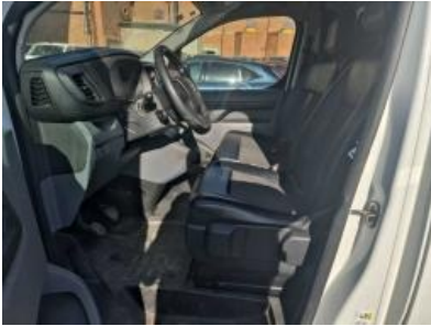
Imagen - 10