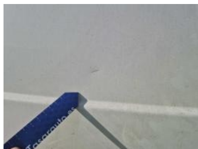
Imagen - 35