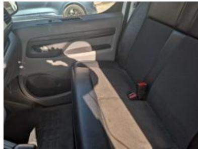
Imagen - 14