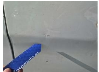
Imagen - 27