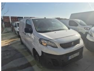
Imagen - 4