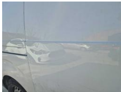
Imagen - 23