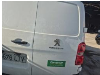
Imagen - 29