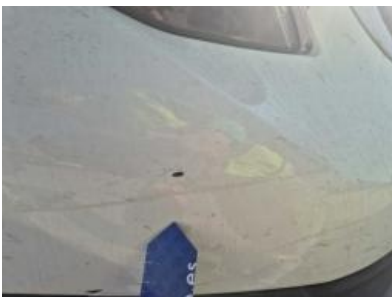
Imagen - 49