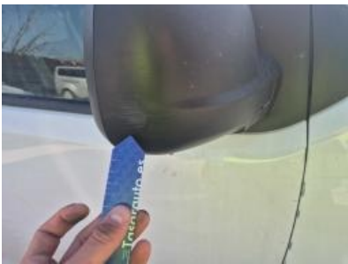
Imagen - 22