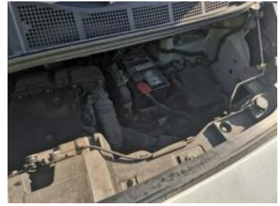
Imagen - 9