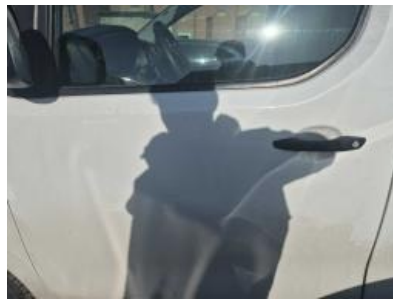
Imagen - 38