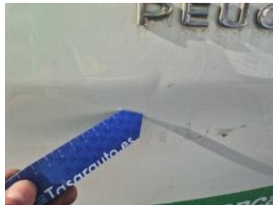
Imagen - 26