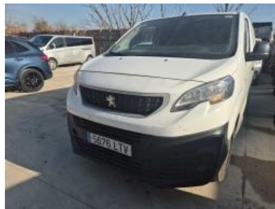
Imagen - 44