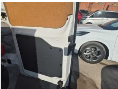
Imagen - 19