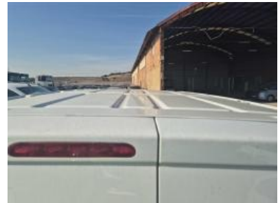
Imagen - 15