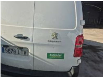
Imagen - 25