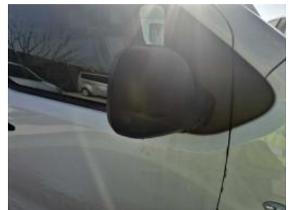
Imagen - 21