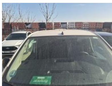
Imagen - 5