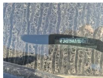
Imagen - 6