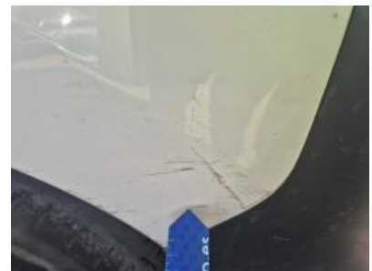
Imagen - 51