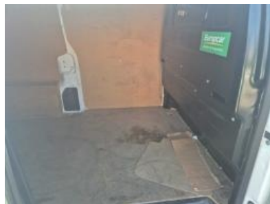
Imagen - 20