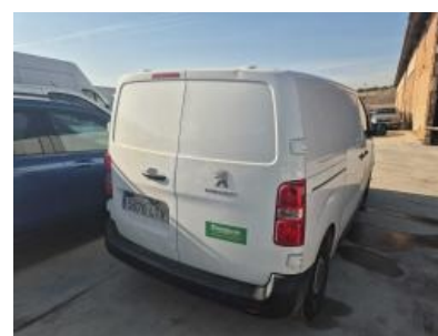
Imagen - 3