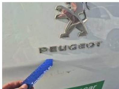
Imagen - 32