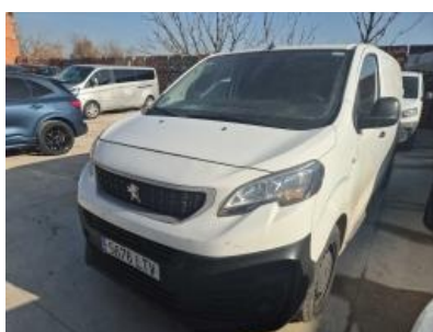
Imagen - 1