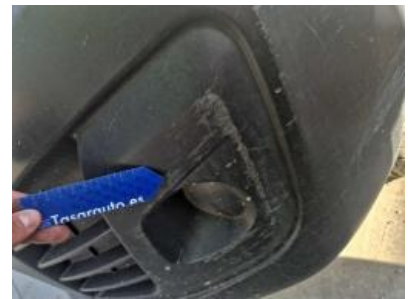
Imagen - 45