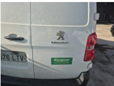
Imagen - 31