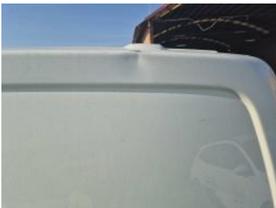
Imagen - 28