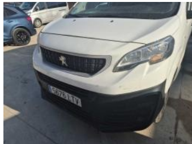
Imagen - 47