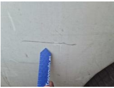
Imagen - 37