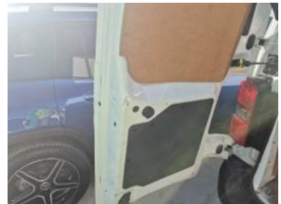
Imagen - 18