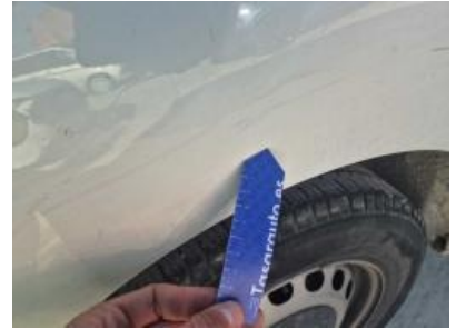
Imagen - 57