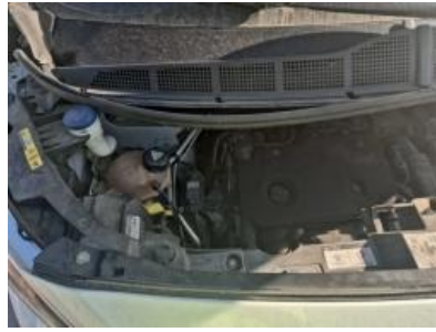
Imagen - 8