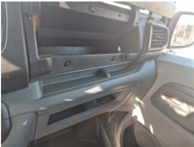
Imagen - 13