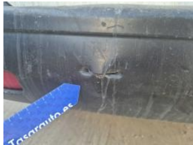
Imagen - 59