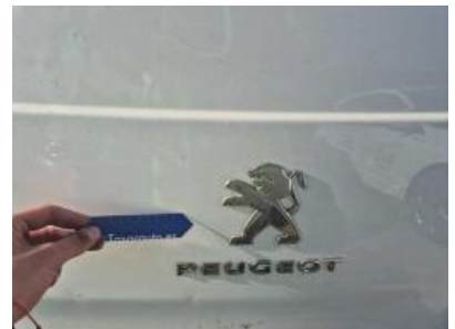
Imagen - 30