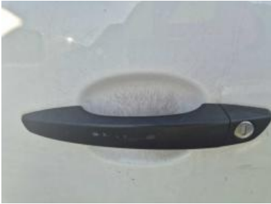
Imagen - 40