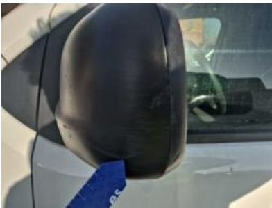
Imagen - 43