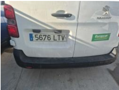
Imagen - 58