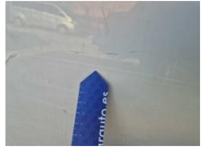
Imagen - 54