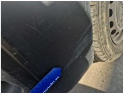
Imagen - 46