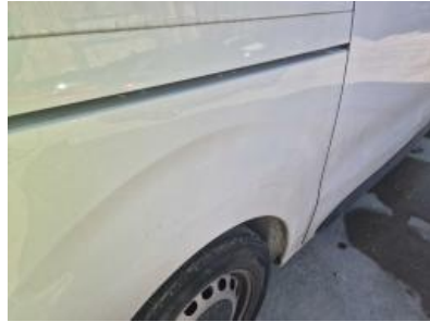
Imagen - 56