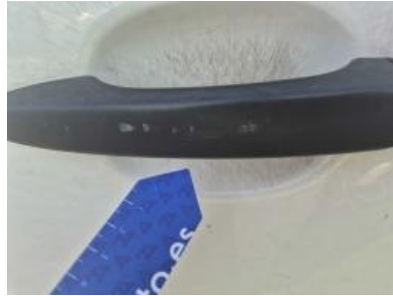
Imagen - 41