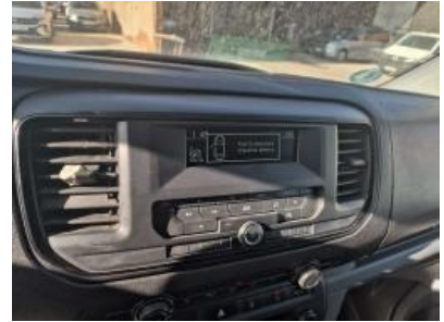
Imagen - 12