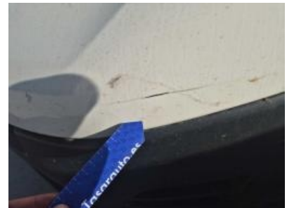
Imagen - 48