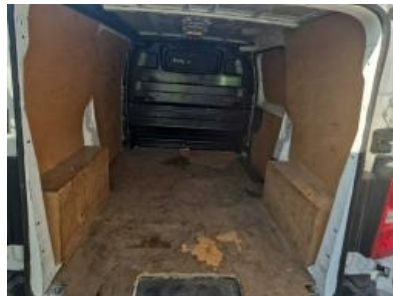
Imagen - 17