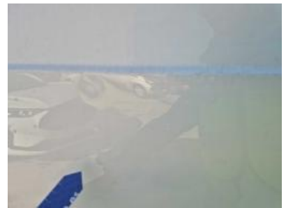
Imagen - 24