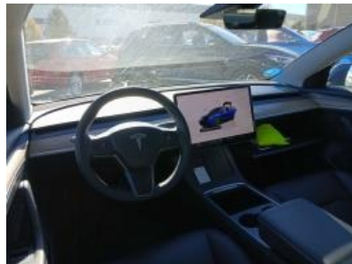
Imagen - 14