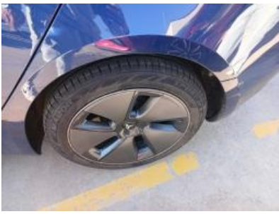
Imagen - 40