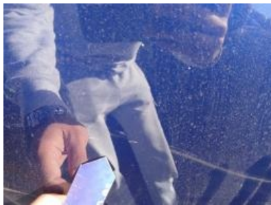
Imagen - 47