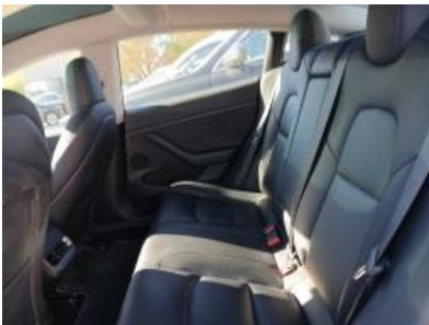
Imagen - 13