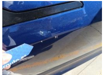
Imagen - 51