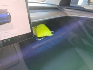
Imagen - 10