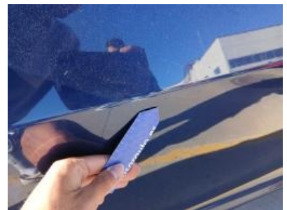
Imagen - 36