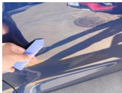
Imagen - 38