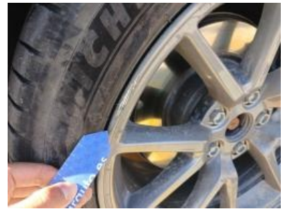
Imagen - 33