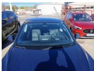
Imagen - 5