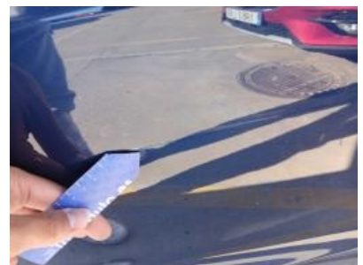
Imagen - 39