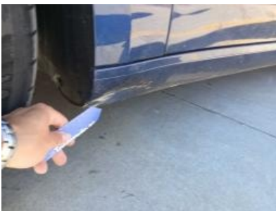
Imagen - 34