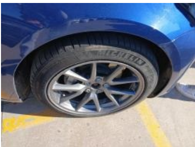
Imagen - 52