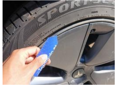
Imagen - 45