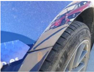
Imagen - 31