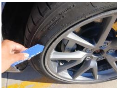
Imagen - 53