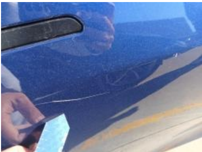
Imagen - 49