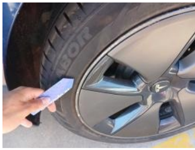
Imagen - 41