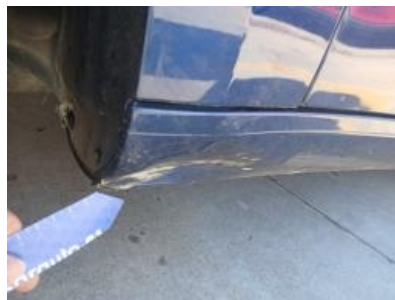
Imagen - 35