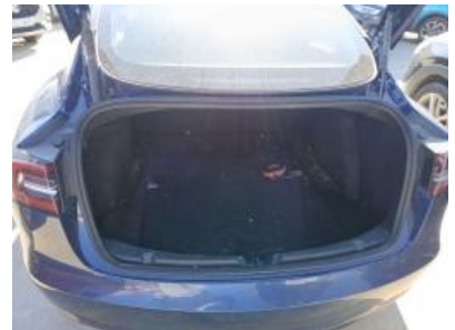
Imagen - 15