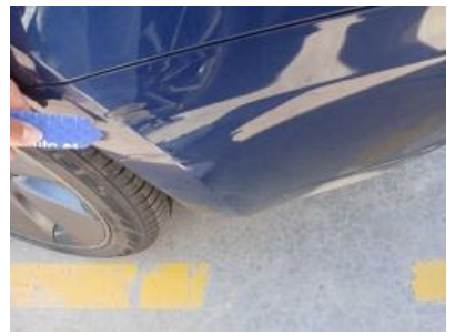
Imagen - 42