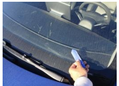
Imagen - 54