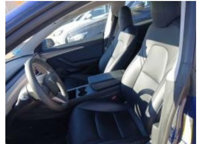
Imagen - 12