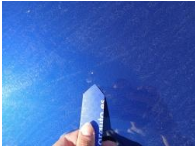
Imagen - 56