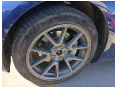
Imagen - 32