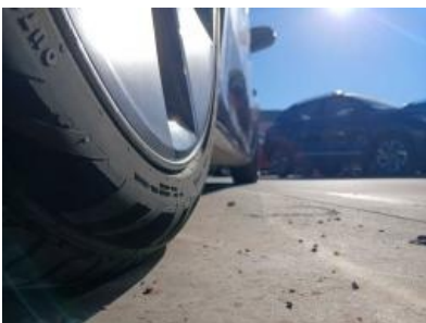
Imagen - 19