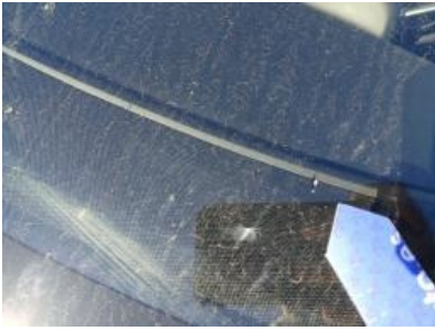
Imagen - 55