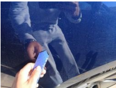
Imagen - 46