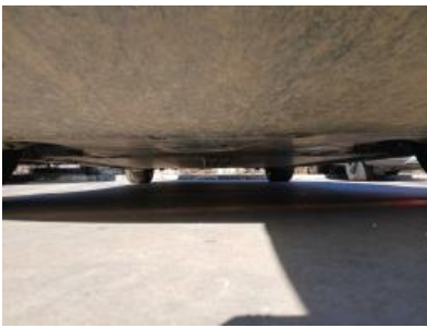
Imagen - 7