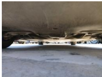
Imagen - 17