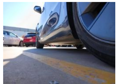
Imagen - 21