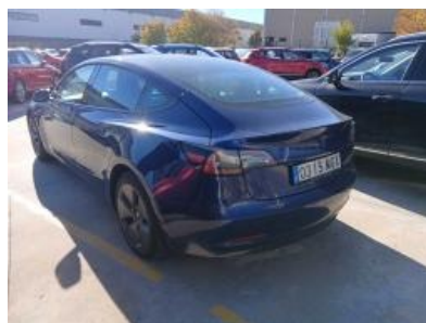
Imagen - 2