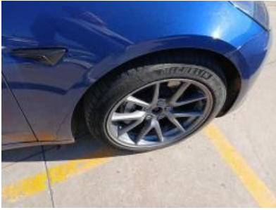
Imagen - 25