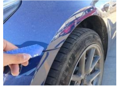
Imagen - 30