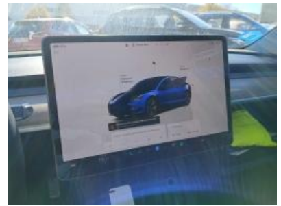
Imagen - 9