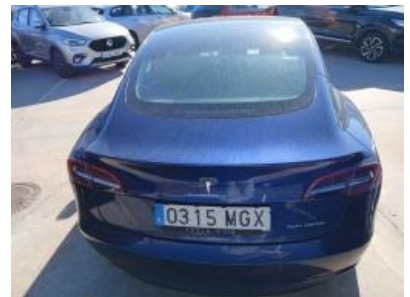
Imagen - 18