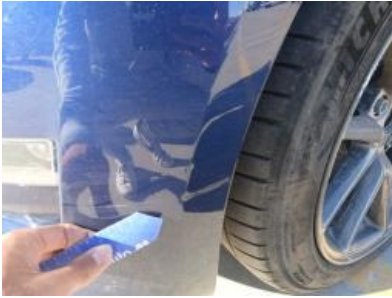
Imagen - 28