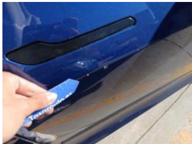
Imagen - 50