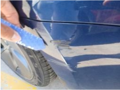
Imagen - 43