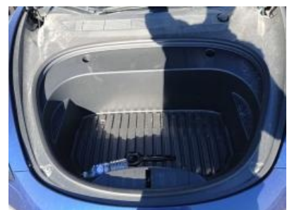
Imagen - 6