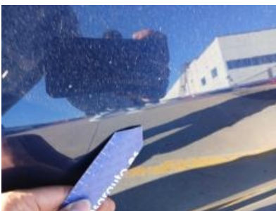
Imagen - 37