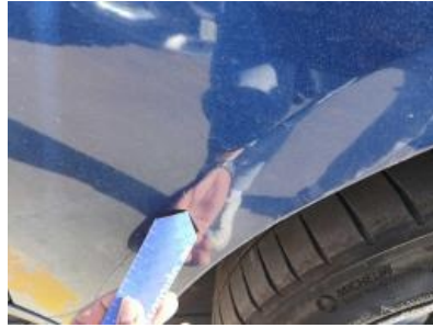
Imagen - 26