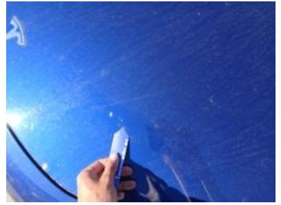
Imagen - 57