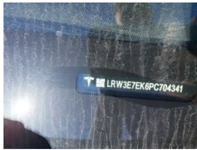
Imagen - 8