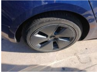
Imagen - 44