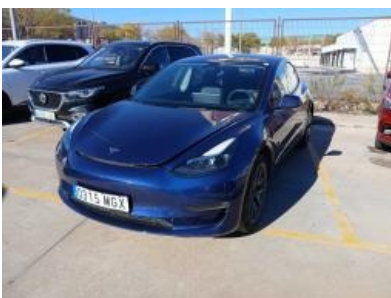
Imagen - 1