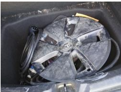
Imagen - 16