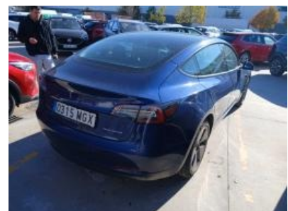
Imagen - 3