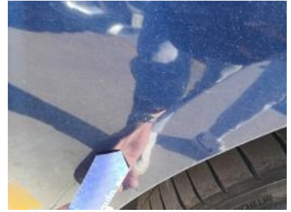
Imagen - 27