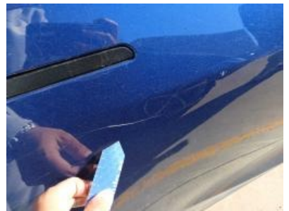
Imagen - 48