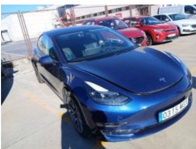
Imagen - 4