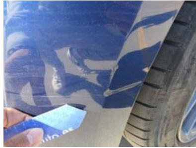
Imagen - 29