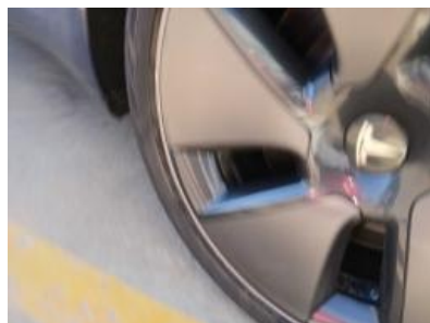
Imagen - 20