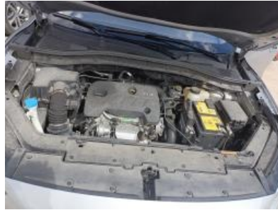
Imagen - 11