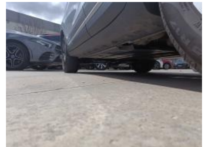
Imagen - 18