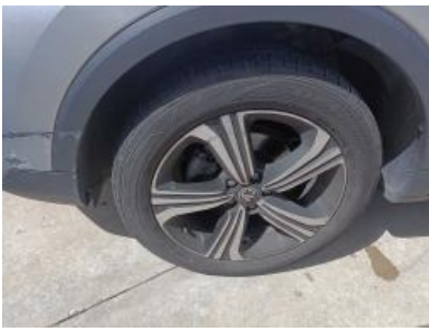
Imagen - 22