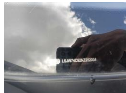
Imagen - 6