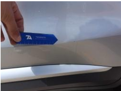
Imagen - 31