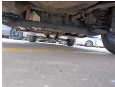
Imagen - 17