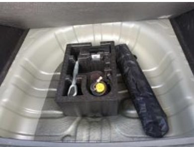
Imagen - 16