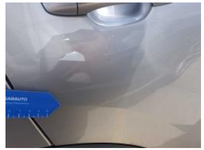
Imagen - 39