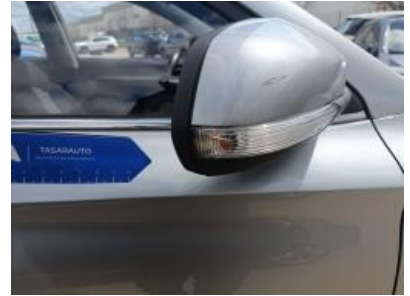
Imagen - 42