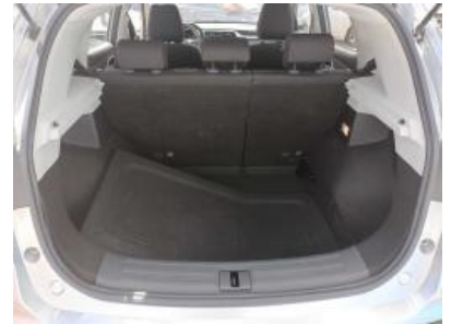
Imagen - 15