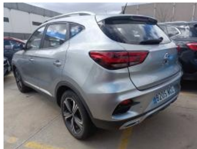
Imagen - 2