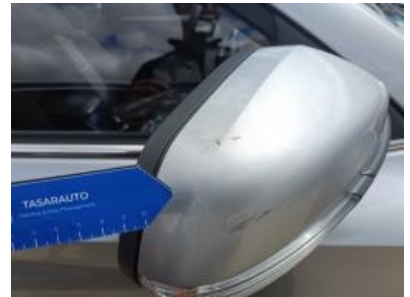
Imagen - 45