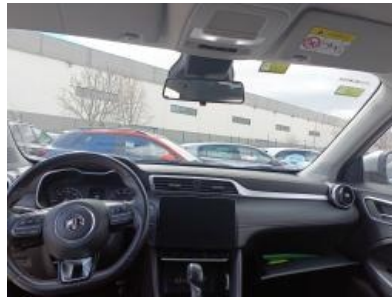
Imagen - 14