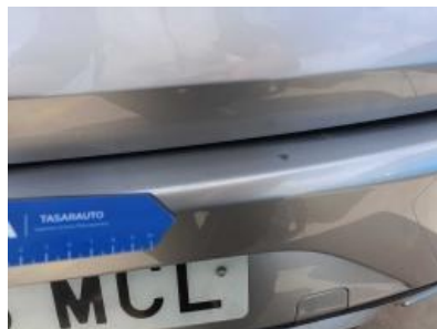
Imagen - 35