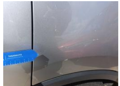
Imagen - 33