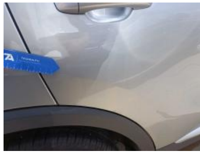
Imagen - 38