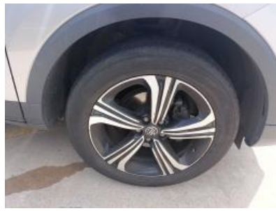
Imagen - 23