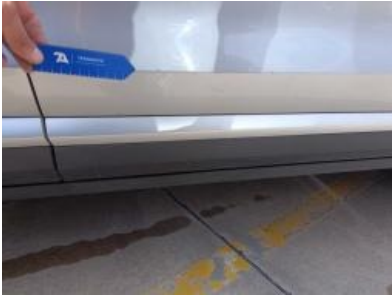
Imagen - 40