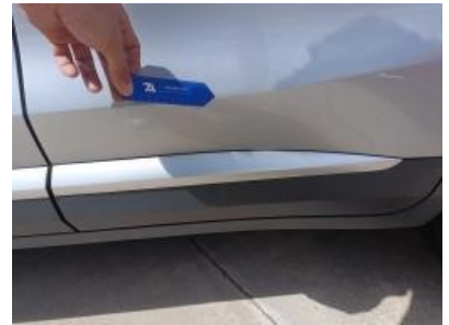
Imagen - 30