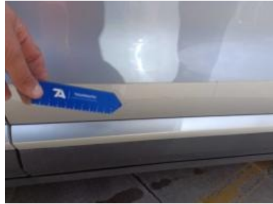
Imagen - 41