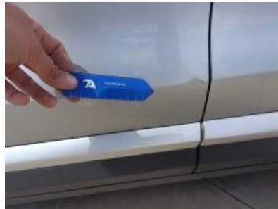
Imagen - 29