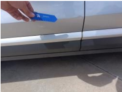
Imagen - 28