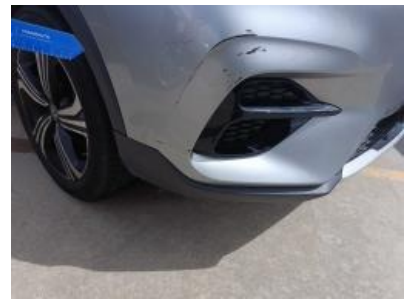
Imagen - 24