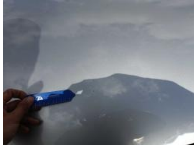
Imagen - 26