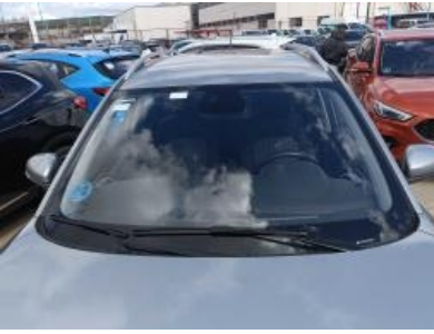
Imagen - 7