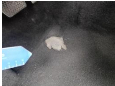
Imagen - 47