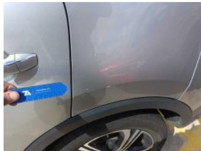
Imagen - 32