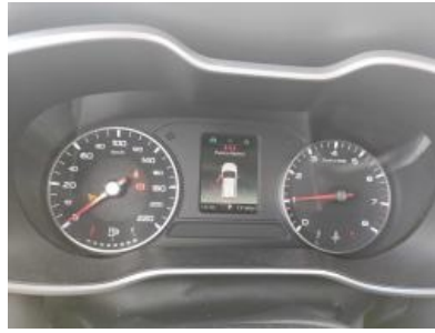
Imagen - 8