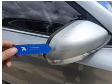
Imagen - 44