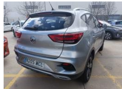
Imagen - 3