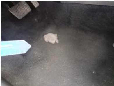
Imagen - 46