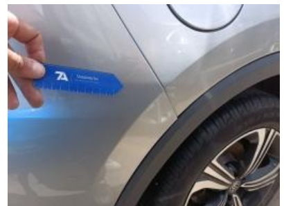
Imagen - 36