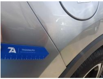
Imagen - 37