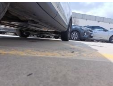
Imagen - 19