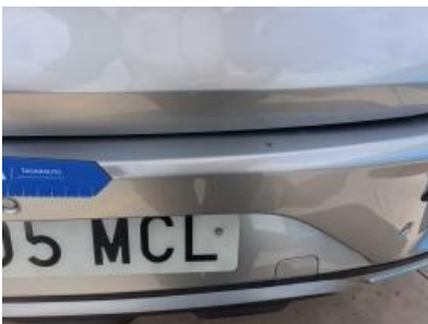
Imagen - 34