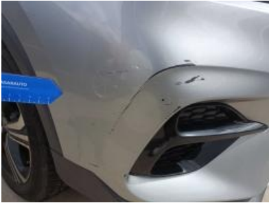
Imagen - 25