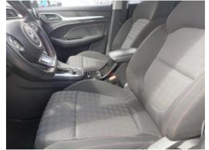
Imagen - 12