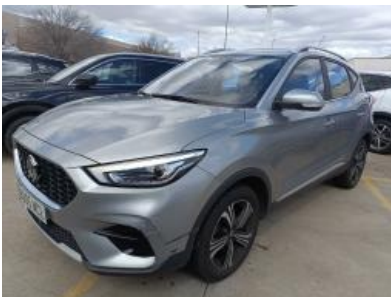
Imagen - 1