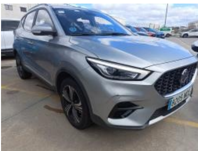
Imagen - 4