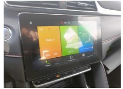
Imagen - 9