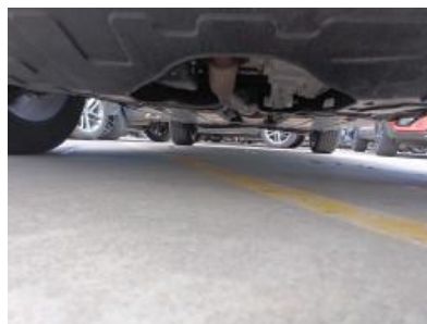
Imagen - 5