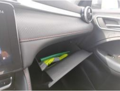
Imagen - 10