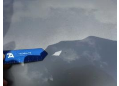
Imagen - 27