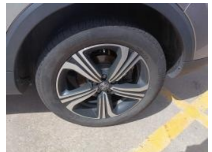
Imagen - 21