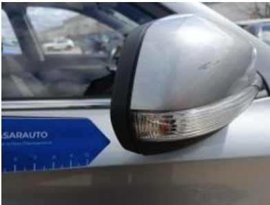
Imagen - 43